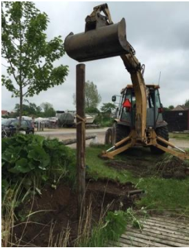
Nye forankringspæle rammes ned