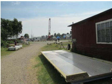
Den yderste del af jollerampen klar til søsætning