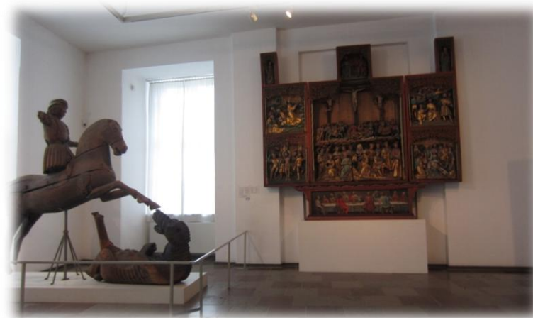
Kirkeudsmykning fra middelalderen

ten! Slottet, der i dag rummer et stort og flot museum, fik sin nuværende plads på en ø i bunden af Slien i slutningen af 1100-tallet, hvor Valdemar den store lod opføre en befæstet bygning, der kaldtes "hele Danmarks lås og lukke", da hovedfærdelsåren dengang og i de følgende århundreder helt op til 1864 gik øst om de fugtige marsk- og engområder og vest om Sliens vande.