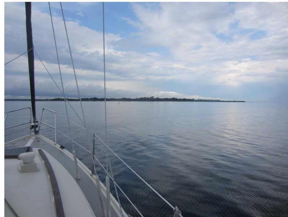
Indsejlingen til Haderslev Fjord ved Ørby Hage