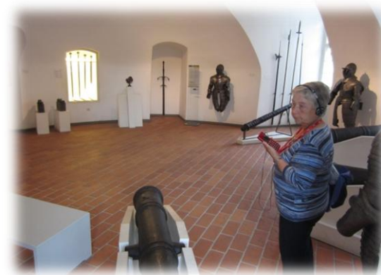
Våben fra middelalderen