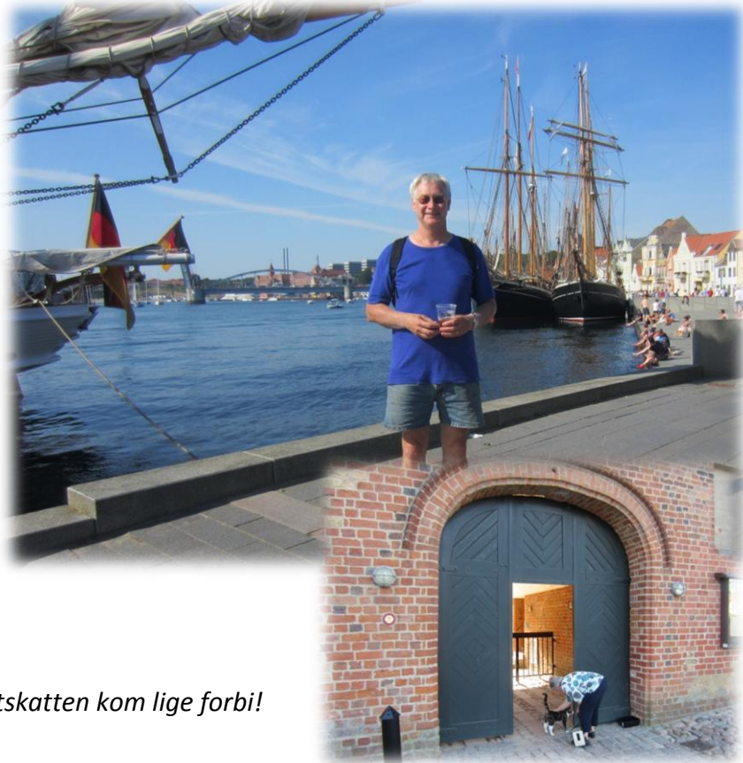
Slotskatten kom lige forbi!

Og ved honnørkajen ved slottet lå en sværm af "oldtimere" fortøjet med udskænkning af fadøl og harmonikamusik i teltet. DET har sviger-sønnerne endnu aldrig kunnet præstere. Grillpladsen ved havnen var vel besøgt – vi aftenskaffer nu på DAGMAR, mens solen lister der ned ad og skruer ned for varmen! 27 sømil.