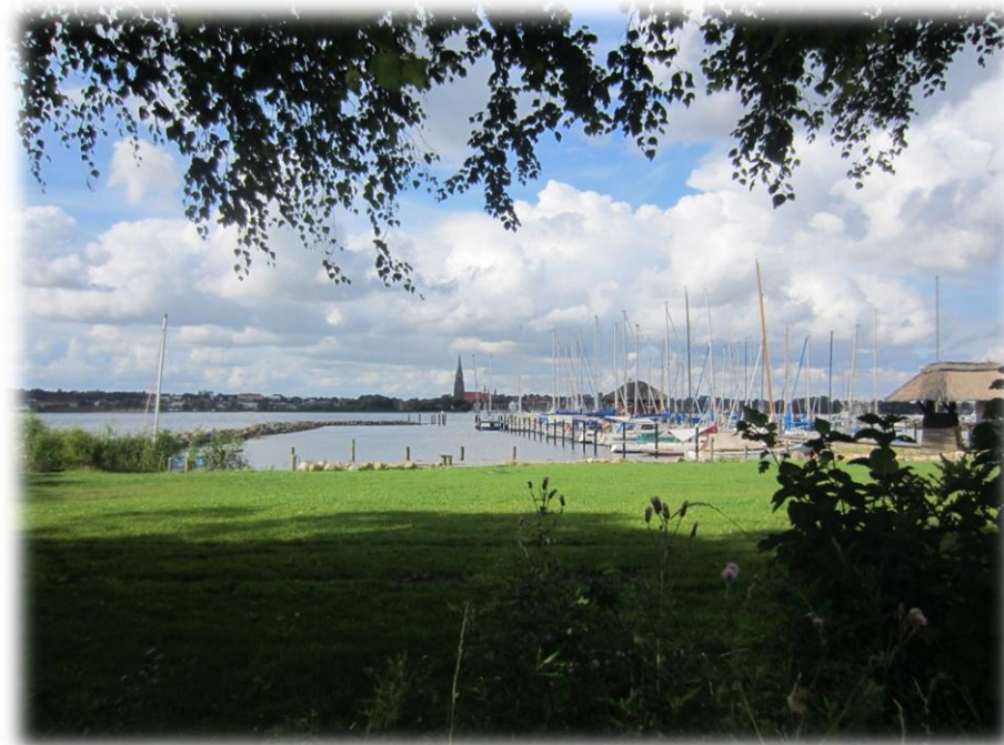
Schleswig Domkirke set fra Hedeby Lystbådehavn

Ansgar – også kendt fra Ribe og omegn – har fået sin egen markering i form af et monument ved siden af den nuværende kirke i Hedeby. Efter gårsdagens museumsvandring på Gottorp Slot, var behovet for flere montre-indtryk begrænset, så vi sprang museet i Hedeby over. Vi har set glasperler og vikingskibe, våben og dingener i massevis hjemme i Ribe.