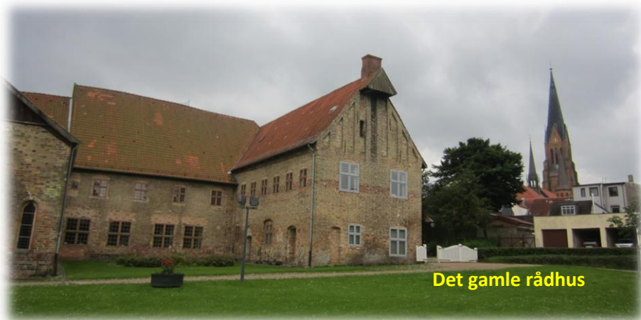
Det gamle rådhus