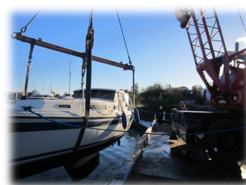
Op af vandet!