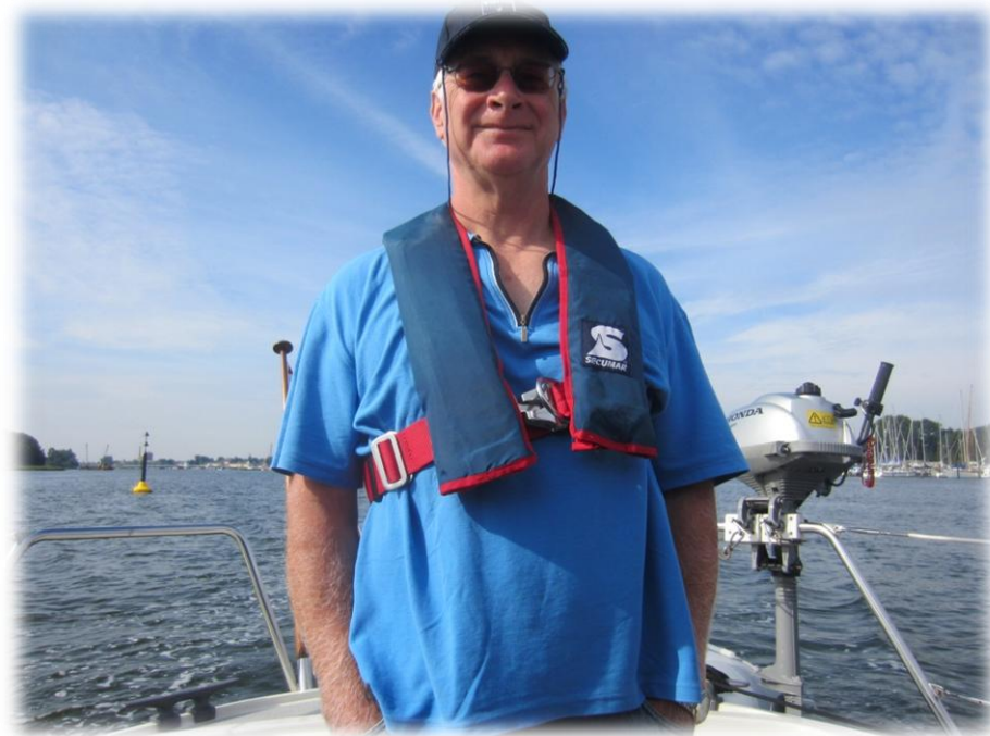
Støt står den danske sømand!

lige motorrummet, som jeg fandt sort af sod! Der var en læk på udstødningsrøret. Ikke noget farligt, men det skabte et modbydeligt svi-neri.