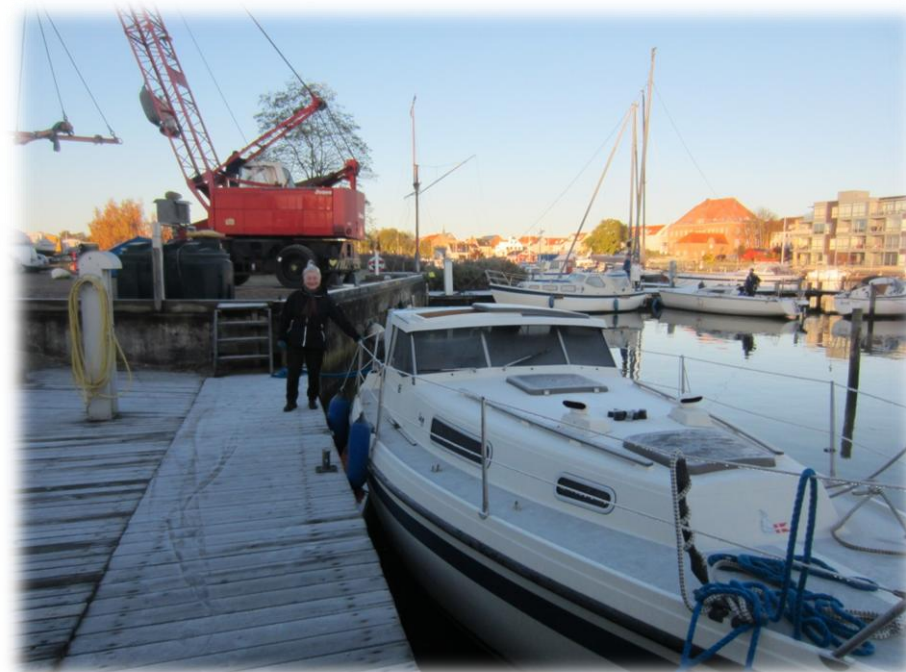
En stivfrossen DAGMAR venter på kranen

Så kom DAGMAR på land. En kold frostmorgen, hvor skuden var dækket af is og et tykt lag rim og fortøjningerne stive af frost, gjorde den sidste tur fra broen til kranen en kold fornøjelse. Dog inden længe fik solen magt, og DAGMAR kom på plads i sit stativ - i år så yderligt på bådpladsen, som aldrig før. Og fra sin vinterplads hilste hun af med vor gode ven Havørnen, der forfulgt af en skræppende krage svævede hen over os på sine mægtige vinger. DAGMARS bund var mørk af alger og slim, men ikke mange rurer var at se, så en gang med højtryksrensere gjorde atter bunden glat og ren.