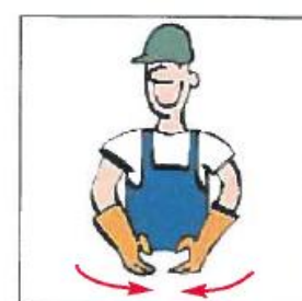
Lukke udstyr (grab)