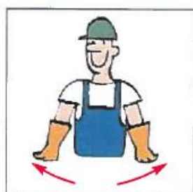
Åbne udstyr (grab)