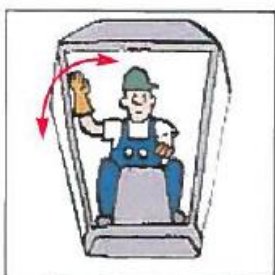
Signal ikke forstået